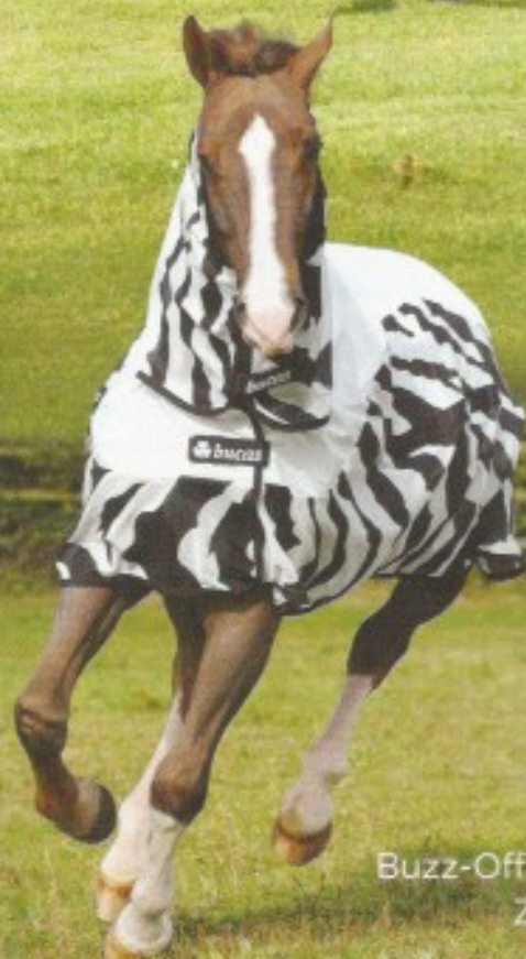
Buzz-Off Rain Zebra